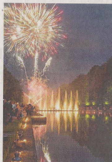
Beim Benrather Musikfestival darf am Samstagabend das große Feuerwerk nicht fehlen.

Das Lichtermeer im Schlosspark für ein besonderes Sommer-Erlebnis. Zu den Klängen bekannter klassischer Werke bewegen sich im Spiegelweiher die Fontänen des Springbrunnens, werden das Benrather Schloss und Bäume in romantisches Licht getaucht und sorgt ein Musikfeuerwerk für optische Höhepunkte.