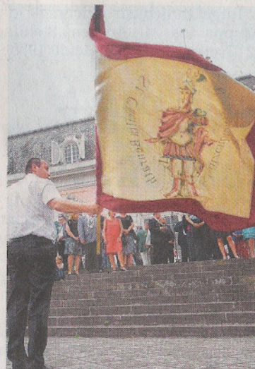
Die große Parade der Benrather St. Cäcilia-Schützen vor dem Schloss ist am Sonntag um 16 Uhr.