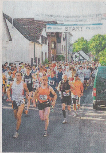
Um 8 Uhr gehen die Läufer am Samstag für den Halbmarathon in Himmelgeist an den Start.

Brauchtumsfest Die Benrather St. Cäcilia Schützen feiern am Wochenende ihr 458. Schützen- und Heimatfest. Der Große Zapfenstreich beginnt am Samstag um 18.45 Uhr auf dem Benrather Marktplatz – und nicht wie seit hundert Jahren Tradition – vor dem Schloss. Sonntag gibt es ab 11.30 Uhr ein Biwak auf dem Marktplatz. Beim Großen Festzug zur Parade am Benrather Schloss, die um 16 Uhr beginnt, marschieren die Schützen ab 15 Uhr von der Bayreuther Straße aus. Abends